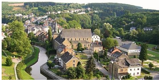
Houffalize ligger nedbäddad i floden Ourthes dalgång.