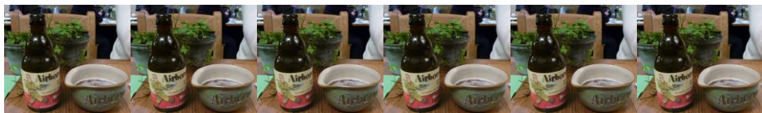
Vince Speranzas öl Airborne drick traditionsenligt ur en hjälm i porstin.

Därefter för de som önskar det, tillfälle till shopping i Bastognes centrum fram till kl 16.00.