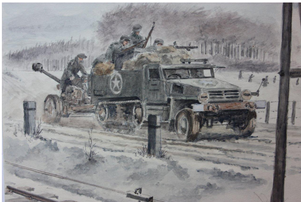
Målning av Horst Helmus, tysk soldat i Ardenneroffensiven.

Anmälan sker genom att betala in anmälningsavgiften 1 500 kr till bankgironummer 576-4162 för Vaktel Förlag (vidare betalning i höst) samt att maila in bekräftelse till vaktelforlag@gmail.com