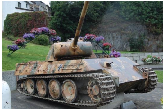
Panthern i Houffalize.

När vi har sett oss mätta på bryggeriet med omnejd, tar vi bussen till staden Houffalize, där vi inkvarterar oss på Hotel Ol' Fousse och äter gemensam middag. Senare på kvällen följer de som vill med till stan och tittar på den vackra staden och den tyska Panther-stridsvagnen från tyska 116. pansardivisionen.