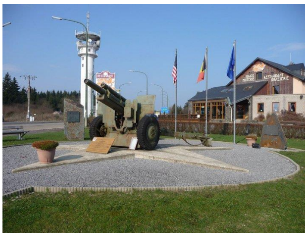
Baraque de Fraiture med värdshuset i bakgrunden.