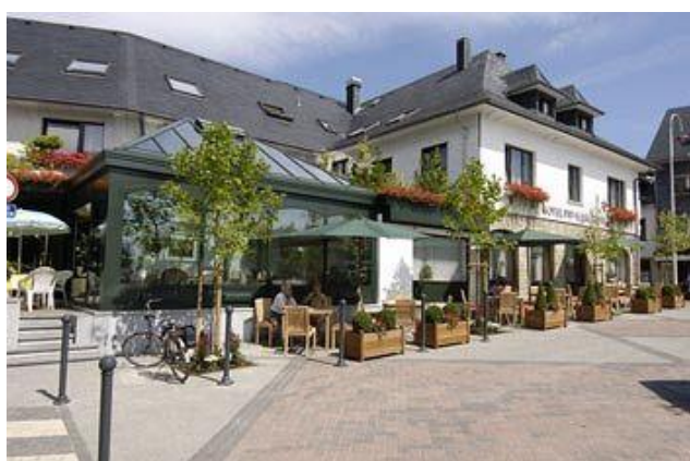
Den tyskspråkiga staden Sankt Vith.