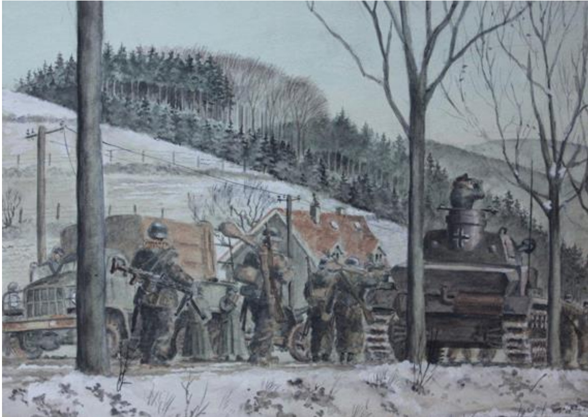
Målning av Horst Helmus, tysk soldat i Ardenneroffensiven.