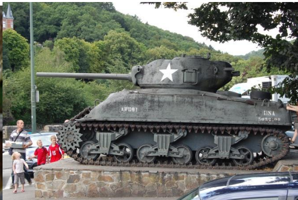
Sherman i La Roche.