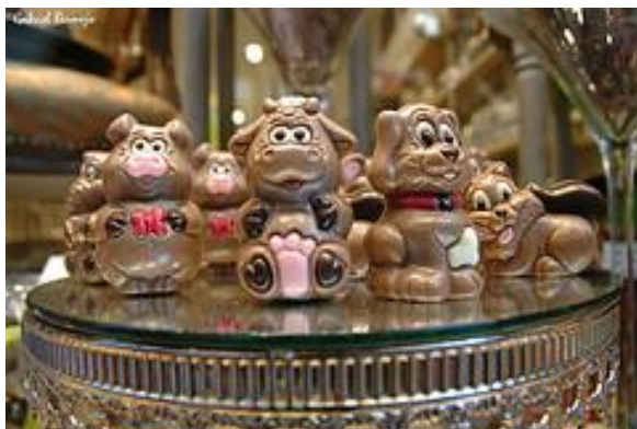
Några av Cyril Chocolates mästerverk.

Se www.batarden.be och www.cyril-boutique.com